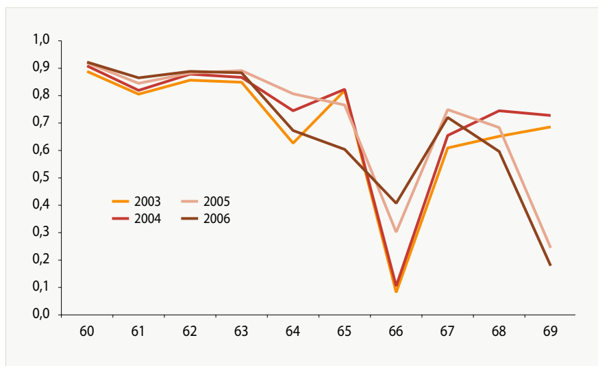
Kuvio 3. Ikääntyneiden työssäjatkamisasteet.