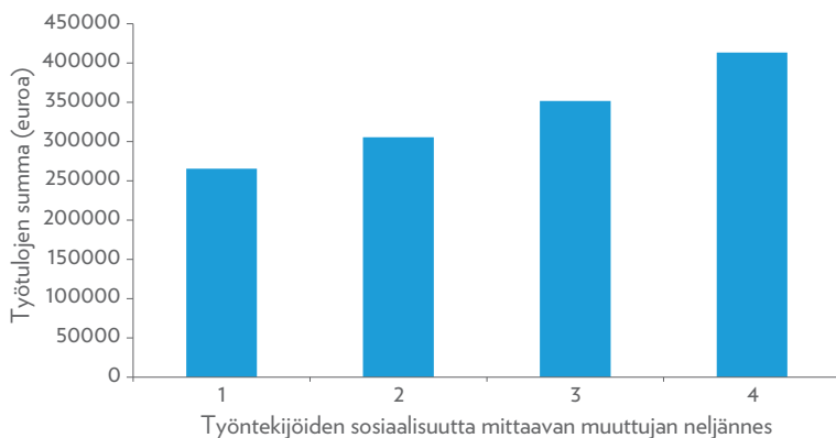
Kuvio 3. Työntekijöiden työtulojen summa vuosina 2005–2014 (vuonna 1975 syntyneille miehille)